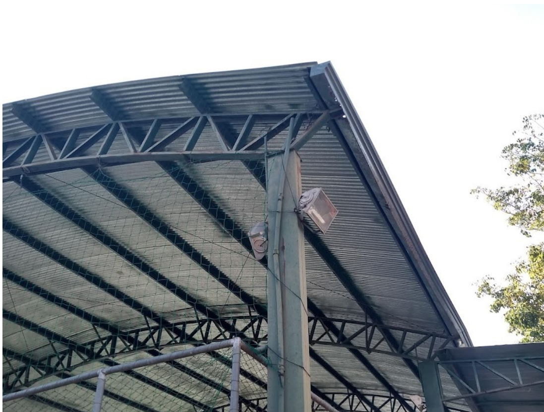
Quadra pequena com calhas danificadas e pintura descascando 25/05/2022

TEL: (32) 3574-1319 – e-mail: licitacao@tocantins.mg.gov.br AVENIDA PADRE MACÁRIO, 129 - CENTRO CEP: 36.512-000 – TOCANTINS/MG