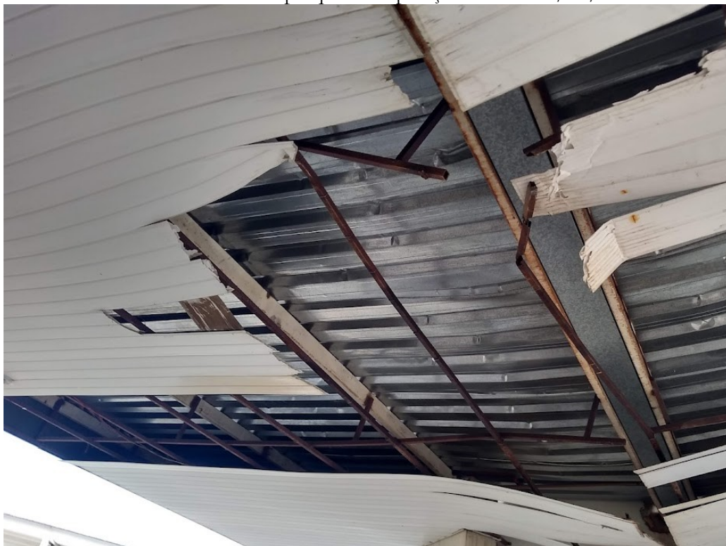
Estrutura e forro em PVC danificados – data 25/05/2022