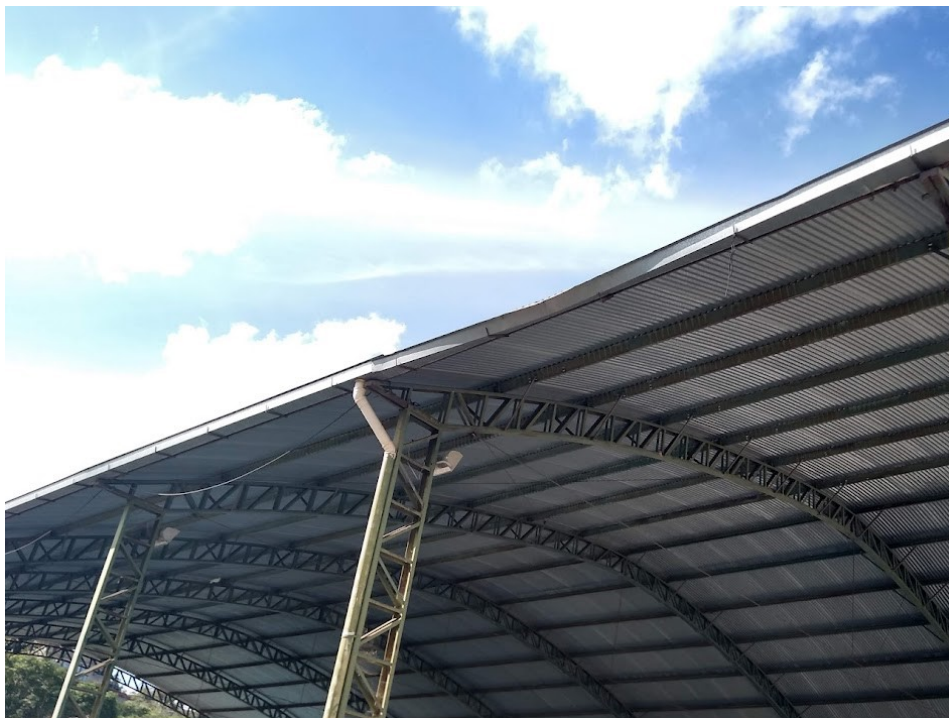
Quadra grande com calhas danificadas e pintura descascando 25/05/2022