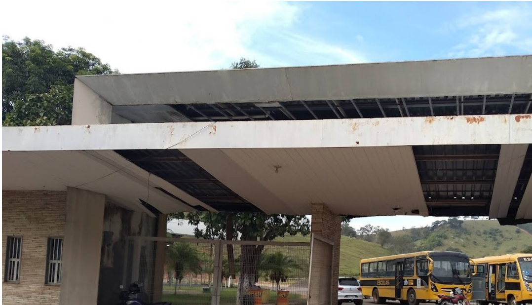
Pórtico de entrada do parque de exposições – data 25/05/2022