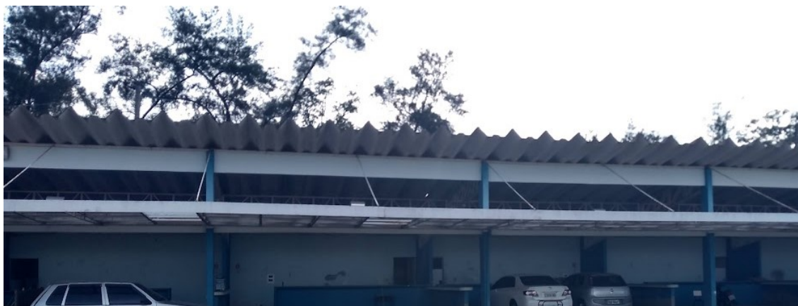
Pergolado a ser substituído – data 25/05/2022