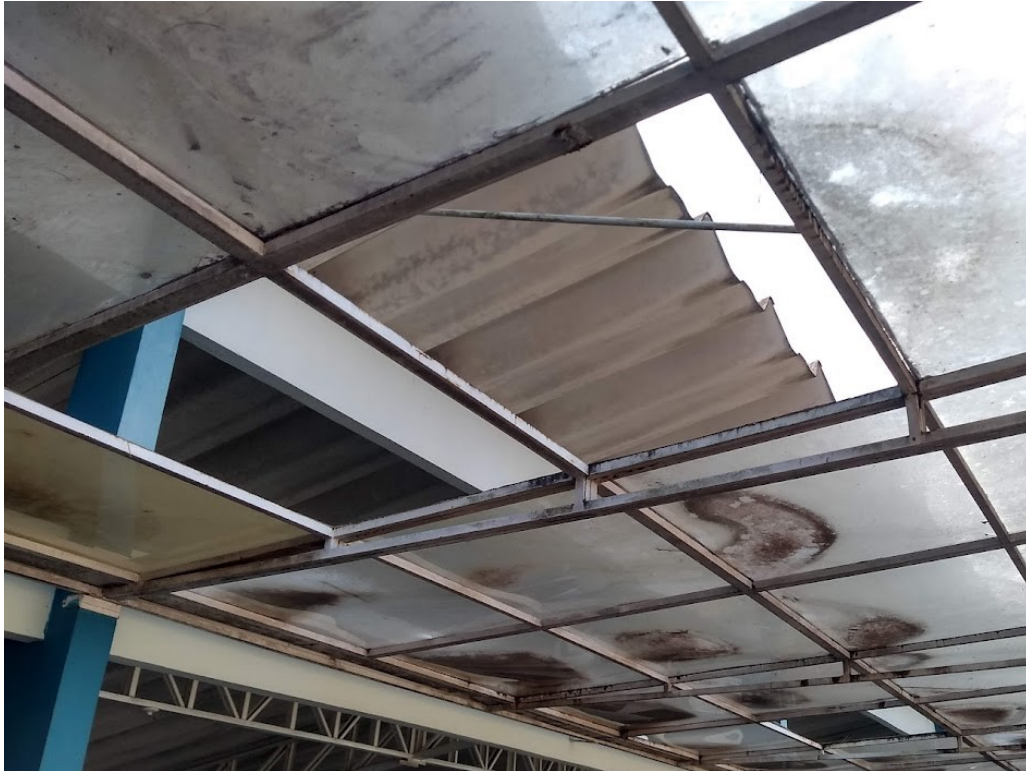
Pergolado a ser substituído – data 25/05/2022

TEL: (32) 3574-1319 – e-mail: licitacao@tocantins.mg.gov.br AVENIDA PADRE MACÁRIO, 129 - CENTRO CEP: 36.512-000 – TOCANTINS/MG