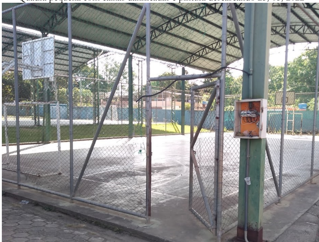
Quadra pequena com calhas danificadas e pintura descascando 25/05/2022