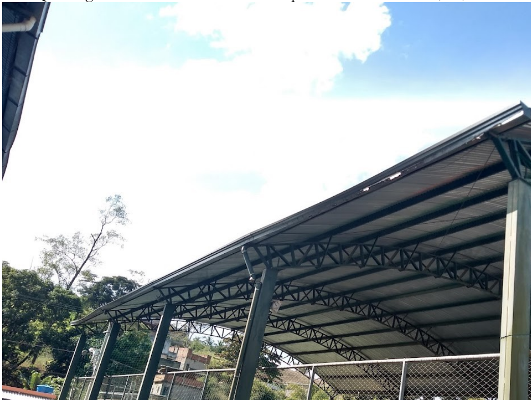
Quadra pequena com calhas danificadas e pintura descascando 25/05/2022