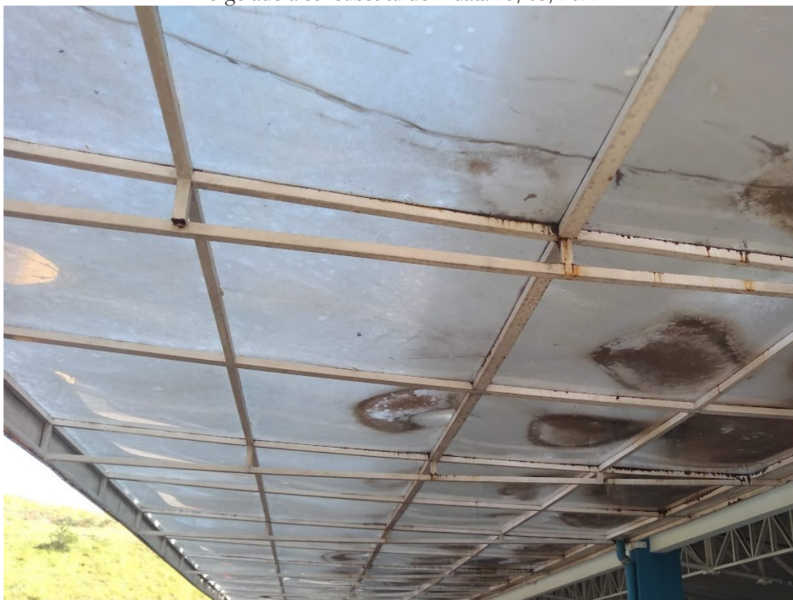
Pergolado a ser substituído – data 25/05/2022