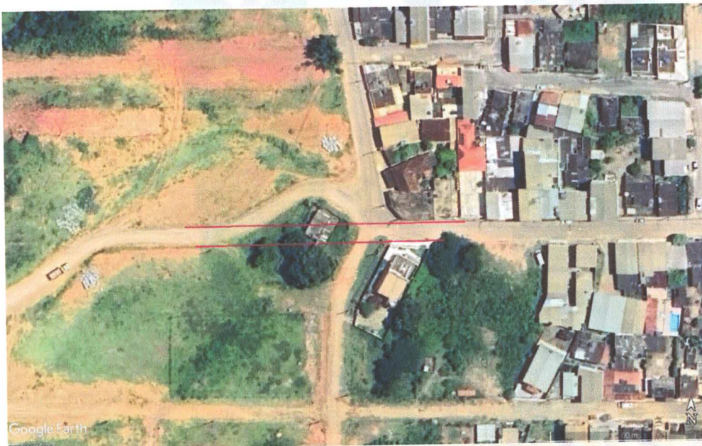
Imagem satélite google2022 : linhas vermelhas são referências de alinhamento