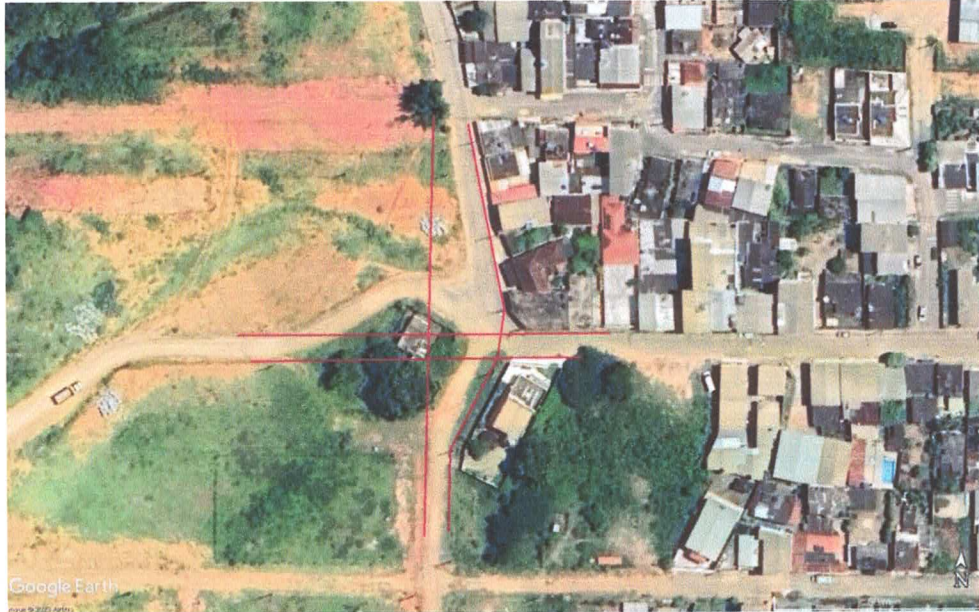
Imagem satélite google2022 : linhas vermelhas são referências de alinhamento.

No desenho proposto, a casa será demolida para alinhar a Av. Joaquim Dias Santiago, e devido ao alinhamento da rua Dezoito vinda do loteamento novo horizonte, surgirá um cruzamento largo o suficiente para implantação de canteiros centrais e rotatórias.